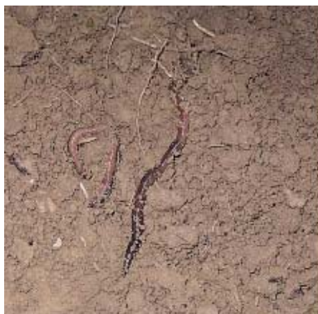
I lombrichi sono importantissimi nel processo di degradazione dei residui colturali