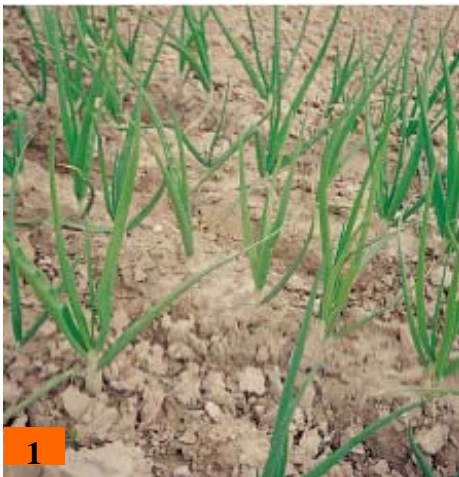
1- Esempio di terreno caratterizzato da un'elevata presenza di limo.

Il terreno, oltre ai sopra citati costituenti, ne ha un altro che in agricoltura biologica è considerato il più importante: la sostanza organica. Ricordiamo che, in inglese, agricoltura biologica si dice « organic farming ». La sostanza organica è formata dalle sostanze sintetizzate dagli organismi che popolano il terreno e dall'insieme dei residui delle piante, degli animali e dei microrganismi nei vari stadi di decomposizione. Essa può essere completamente degradata - mineralizzata - dagli organismi del terreno con conseguente liberazione di principi nutritivi assimilabili dalle piante, oppure decomposta parzialmente e convertita in humus.