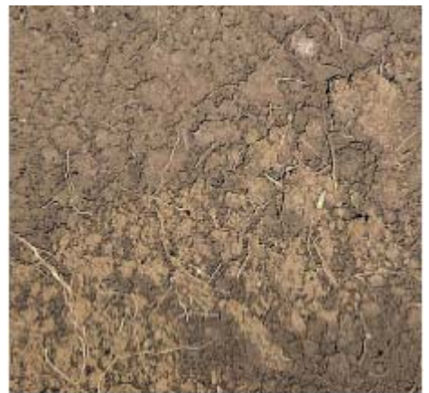
Un terreno ben strutturato (sopra) posto a confronto con un terreno mal strutturato in cui si notano formazione di crosta e crepacciamento (sotto). In presenza di una buona struttura le radici esplorano meglio il terreno, possono assorbire acqua e principi nutritivi ed avere ossigeno per i propri processi vitali