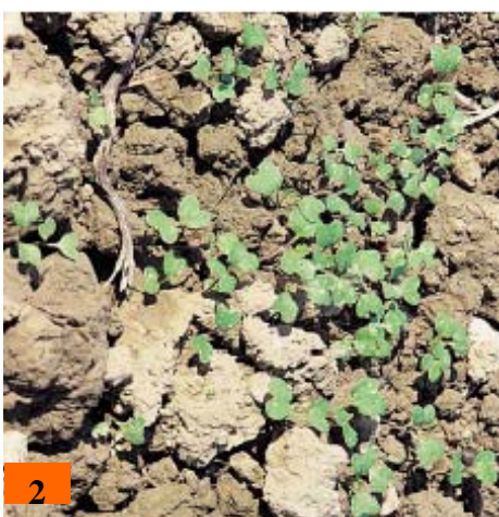
2- Esempio di terreno caratterizzato da un'elevata presenza di argilla