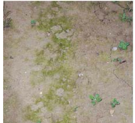
La presenza di alghe in superficie è un preoccupante segnale di una situazione di asfissia del terreno, povero d'aria per l'eccessiva presenza di micropori, in questo momento saturi d'acqua (foto in alto)